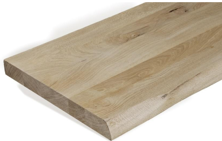
Top "Essential", Rovere Massiccio "Essential" Top, Solid Oak Art. 5410 cm 140x50x5h Disponibile anche / Available also Art. 5409 cm 120x50x5h Art. 5411 cm 160x50x5h

Our oak bathroom tops are made strictly in solid wood, 50 mm thick. It is a precious wood, known for its sturdiness and its burnished, gold-tinged color, which is well suited to any type of decor. All the tops are equipped with straightening bars, to minimize the normal movement of the wood, which by its nature is always a living material.