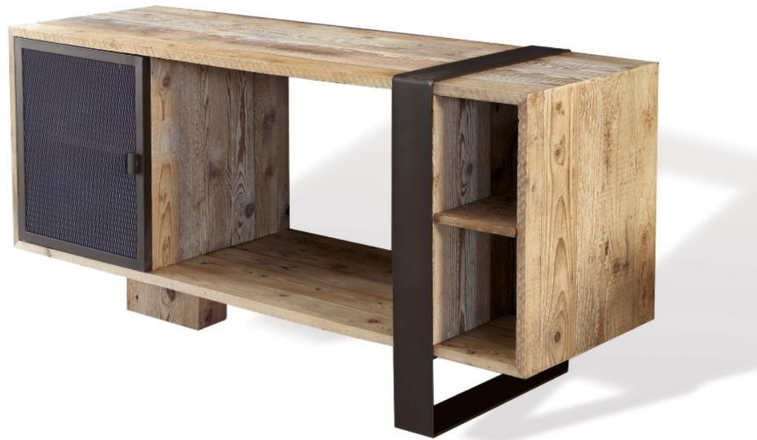
Mobile Bagno Bathroom Cabinet Iron Top Art. 5364, cm 155x50x75h