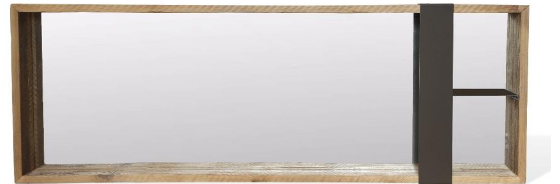
Cornice con specchio Mirror Frame Art. 5365, cm 155x14x55h